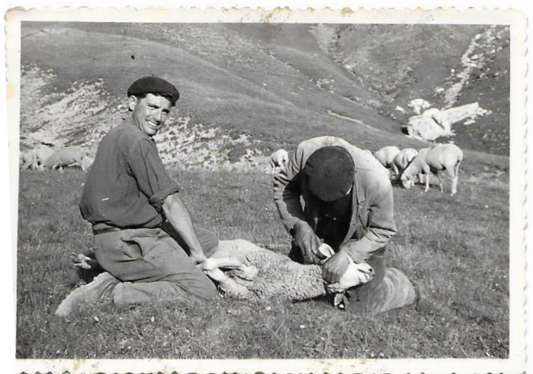
Le berger et son aide en 1958

En général, aux heures les plus chaudes de la journée, c'est la sieste pour tout le monde. Un moment de répit appelé « la chaume », pendant lequel les bêtes s'arrêtent de brouter pour ruminer et se reposer jusqu'à 16h00 au moins. Ensuite, le troupeau s'ébranle doucement et les bêtes vont encore profiter de la pâture jusque tard tout en se rapprochant de la cabane d'alpage. C'est le retour quotidien au parc pour la nuit. C'est aussi le moment où le berger vérifie si l'objectif de la journée a bien été atteint : il observe la panse des bêtes, qui doit être bien rebondie sur les flancs. C'est le signe que les brebis sont « pleines » et peuvent ruminer toute la nuit. Le troupeau sera parqué avec les Patous, à proximité de la cabane. Après avoir bien vérifié le parc (composé de filets électrifiés), il faut alors soigner les plaies avant qu'elles ne s'infectent à cause des mouches, tailler les ongles des brebis qui boitent et nourrir les chiens. Il fait bien sombre quand le berger et son aide peuvent enfin préparer leur repas. Malheureusement dans notre alpage, les deux petites cabanes d'altitude offrent encore aujourd'hui un confort spartiate. Elles n'assurent plus un abri décent à nos bergers. De prochains travaux devraient remédier à cette situation et améliorer ainsi leur quotidien après ces rudes journées.