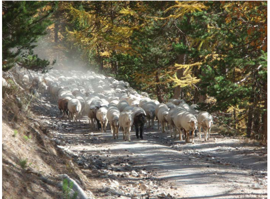
Sur le chemin du retour

Nous voilà rendu au Cougnet dès 6H00 du matin, dans le froid. Le soleil n'apparaîtra que bien plus tard. Nous avons de la chance que la neige ne soit pas de la partie. Il faut bien trier les bêtes avant de redescendre, reconstituer les troupeaux de chaque éleveur et les comptabiliser afin de quantifier les pertes (maladies, accidents, ect...) Fort heureusement ici, depuis quelques années elles sont minimales, de par la vigilance des bergers et l'absence d'attaques du loup dans notre alpage. Malheureusement ce n'est pas le cas dans d'autres vallées. Grâce aux marquages et aux fameux portillons à double voie du parc, actionné avec rapidité et dextérité