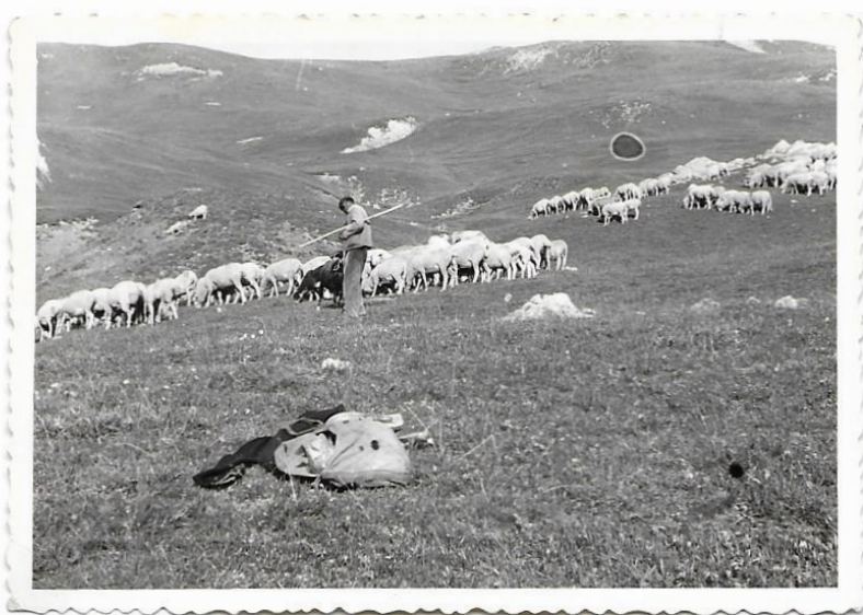
Dans l'alpage en 1958

La conduite d'un troupeau en altitude est une activité complexe, qui fait appel à de multiples compétences. Ici, compte tenu du nombre de têtes, du dénivelé important de l'alpage et de son étendue, l'aide seconde précieusement le berger dans son travail quotidien. Ils doivent assurer la pérennité du troupeau, engagement primordial envers les éleveurs. Aujourd'hui, la présence du loup dans nos montagnes impose une surveillance permanente. Pour eux deux une journée type débute au lever du soleil. Dès 6h00, il faut faire le tour du troupeau, vérifier qu'il n'y a pas de malade parmi les bêtes, repérer les éventuelles boiteuses ou autres. Puis c'est le départ