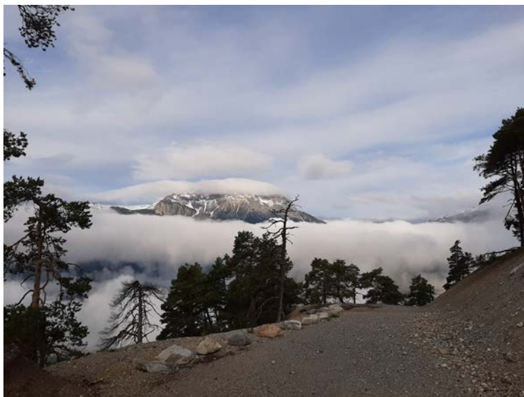
Crêtes de la Rortie

Au petit matin dès 6h00, on ouvre les portes des bergeries, les troupeaux quittent le village. C'est l'excitation. Cette année, avec plusieurs amis, nous accompagnons un troupeau de plus de 300 têtes au départ du Pra (à proximité de la pisciculture). Nous allons parcourir 13km jusqu'au Cougnet, soit 4h00 de marche et 900m de dénivelé positif. L'éleveur, la « Menon » (brebis meneuse) et quelques chiens ouvrent la marche. Nous, nous la fermerons. Très vite nous grimpons dans la côte, encore un peu groggy, mais on s'accroche. Tout heureux d'être ensemble et de partager ces instants uniques. Nous sommes bien couverts, il fait un peu frais, le soleil se lève timidement.