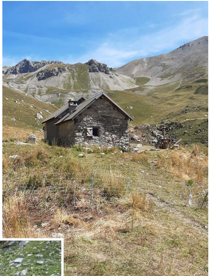
Cabane de Néal

L'estive dure environ 4 mois de mi-juin à mi-octobre. Dans notre vallée, la tradition est de redescendre les bêtes aux alentours de la St Luc (2) de Guillestre. Les dates d'emmontagnée et démon-