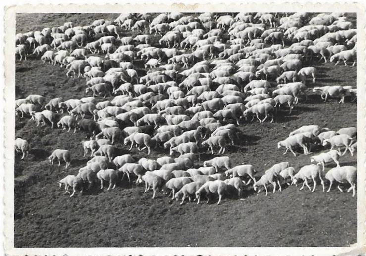
Là-haut dans la montagne

3 – Zone correspondant à un étage de végétation où l'herbe est à maturité au moment où le troupeau y pâture.