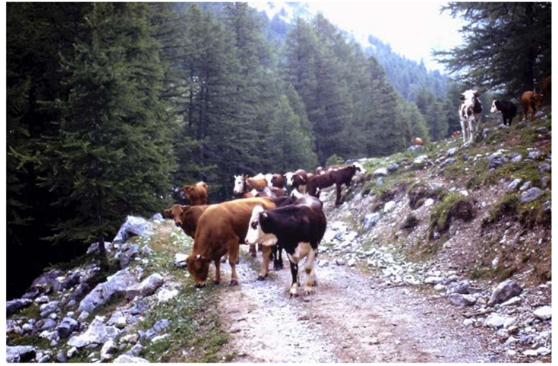
Entre Lauzet et Cougnet en 1970

Jusqu'en 1991 l'alpage de La Roche de Rame accueillait aussi un troupeau de vaches.