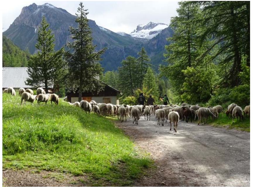
Arrivée au Lauzet

Passé le Calvaire nous rejoignons la route du Lauzet. À ce moment-là, nous entendons les sonnailles (2) des 3 autres troupeaux montant du village par la route et qui progressent joyeusement juste un lacet plus bas. Le bruit des sonnailles s'intensifie. Nous suivrons la route jusqu'au deuxième pont du Giet, puis les raccourcis jusqu'au Lauzet. Comme à chaque fois à l'arrivée, le spectacle est unique: le petit lac, les chalets, le mélézin, les montagnes de part et d'autre de cette petite vallée en cul-de-sac et les dernières plaques de neige vers Néal. Nous nous imprégnons du lieu.