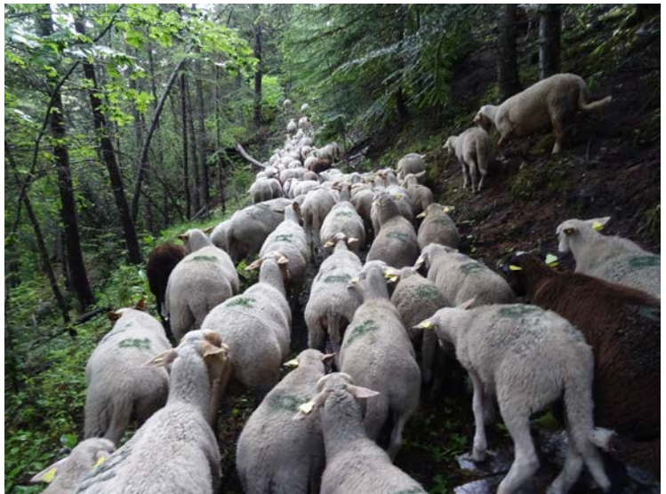
Sur les sentiers

Dans les régions montagneuses, la plupart des troupeaux quittent les vallées en juin pour rejoindre les alpages. Cette transhumance est une pratique indispensable à l'équilibre économique et écologique des montagnes (1). Ce « déménagement » a bien sûr pour raison première de faire brouter aux troupeaux une herbe plus grasse, la seconde étant de libérer les prairies de la vallée pour « faire les foins » qui serviront de nourriture aux bêtes tout l'hiver. C'est un moment fort de la vie agricole. Cette transhumance est aussi largement conditionnée par des données climatiques. Ici, à La Roche de Rame, l'emmontagnée s'effectue toujours dans la première quinzaine de juin. Généralement, à cette période tous les éléments sont propices à un bon début d'estive. Le soleil brille, il commence à faire chaud, la belle saison débute, ne subsistent que quelques plaques de neige très haut (au-dessus de 2000m d'altitude) et l'herbe est assez abondante dans les parties basses de l'alpage. Après cette vérification, le groupement pastoral fixe le jour « J ». En 2020 le jour « J » a ainsi été fixé au 10 juin. Ce jour est aussi le meilleur jour de l'année pour l'éleveur qui n'aura plus le souci des bêtes et sera libéré des contraintes qui vont avec pendant 4 mois.