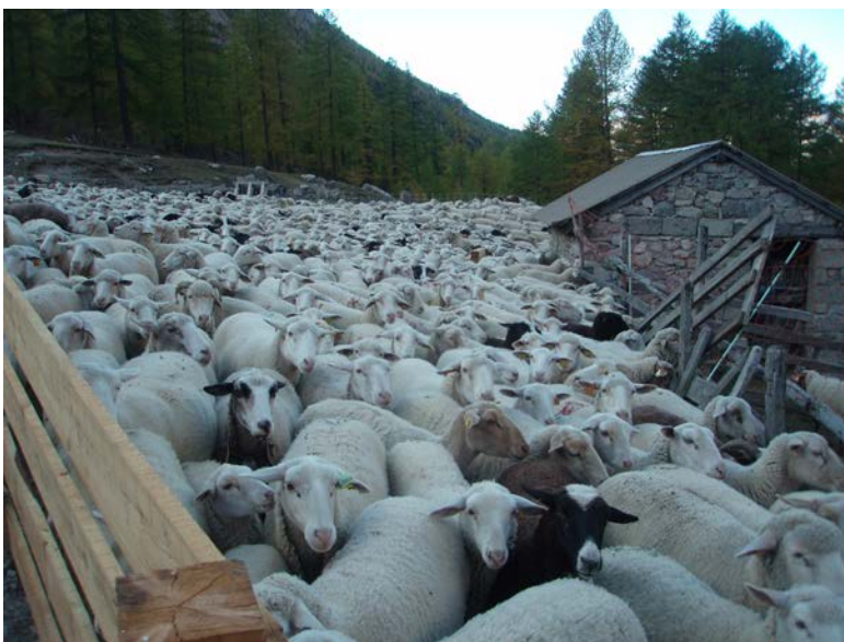
Au Cougnet avant le comptage

Le plus dur est fait. Nous sommes arrivés aux alpages de La Roche de Rame. Les troupeaux se regroupent sur le plan. Il nous reste encore 3 km jusqu'au Cougnet. La fin devient un peu pénible pour quelques vieilles brebis, mais à 10h00 nous atteignons enfin notre but, le camp de base des brebis. C'est presque la fête ! Tout le monde est bien content d'être arrivé, les moutons ont envahi l'espace, les chiens, les accompagnateurs, les éleveurs, le berger et son aide sont là. Quel brouhaha ! Aussitôt, les 1400 bêtes sont parquées. Commence alors le comptage. Opération effectuée par le berger, en silence pour ne pas se tromper sous la surveillance des éleveurs. Par le biais d'un couloir très étroit, toutes les bêtes sont transférées dans un deuxième parc, et bien sûr comptabilisées lors de leur passage. Une fois le décompte terminé et accepté par les deux partis, éleveurs et berger, le troupeau passe sous la responsabilité de celui-ci.