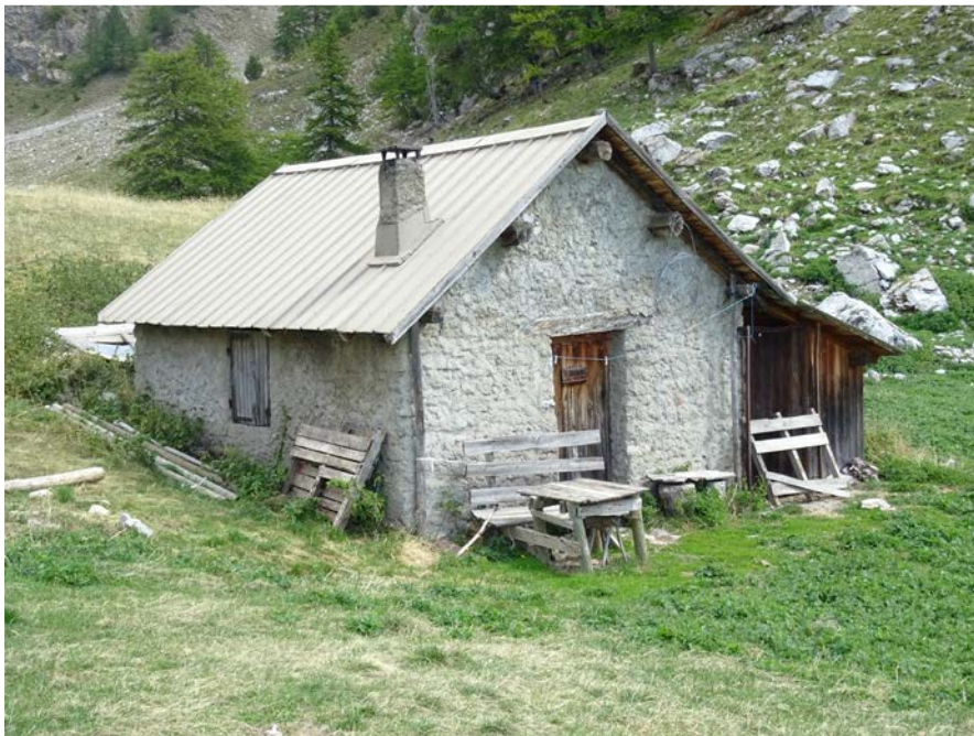
Cabane de l'Alpavin

tagnée sont définies par le groupement et sont souvent tributaires de la météo. Chaque éleveur s'organise pour monter son troupeau au Cougnet, il en sera de même pour la démontagnée. Auparavant il marquera toutes ses bêtes de son propre sigle à la peinture.