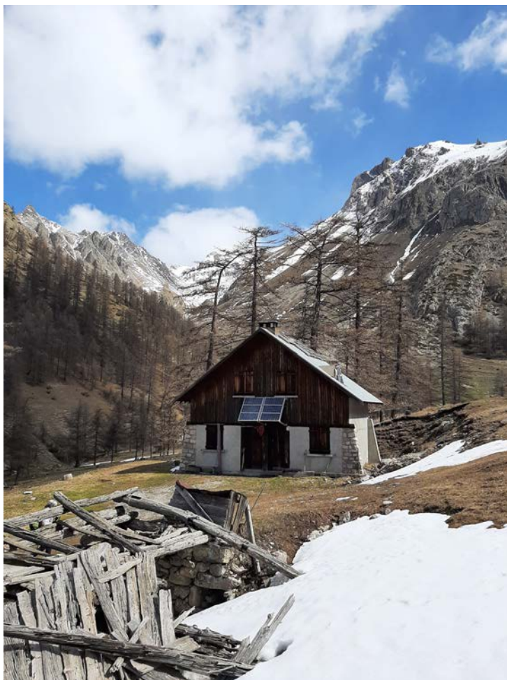
Cabane du Cougnet

reste au bas de l'alpage quelque temps, puis ce sera le jardin d'altitude ! Car il faut aussi préserver cette pâture pour l'automne. En fait, la cabane du Cougnet n'est utilisée par les bergers qu'en début et fin d'estive. Le reste du temps, comme son troupeau, il restera dans les parties hautes de l'alpage et utilisera les deux autres cabanes en fonction des quartiers choisis. Généralement au mois d'août ce sont les quartiers situés les plus hauts en altitude qui sont broutés. En l'occurrence ici c'est toujours l'environnement de Neal.