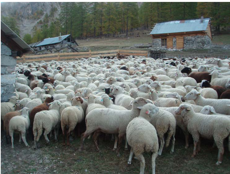
Au Cougnet en 2020

En octobre les brebis sont plus grosses et plus calmes. Le travail se complique si le mauvais temps s'installe, pire si la neige s'invite. On sait que vers 2300m d'altitude, on compte près de 200 nuits de gelées par an.... De ce fait le troupeau pâture maintenant aux alentours du Cougnet, entre 1900m/2000m d'altitude, et y est parqué tous les soirs. C'est l'Automne, Il faut penser à la démontagnée. La Saint Luc approche, mais tant que les conditions météorologiques sont favorables le troupeau restera encore en alpage pour profiter au maximum de la bonne pâture. Petit à petit le froid