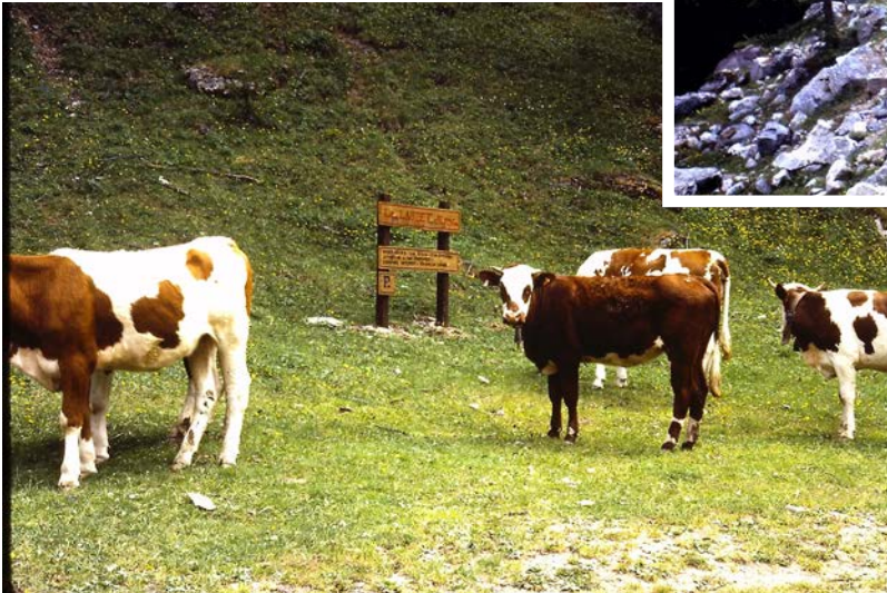
Lauzet en juillet 1981