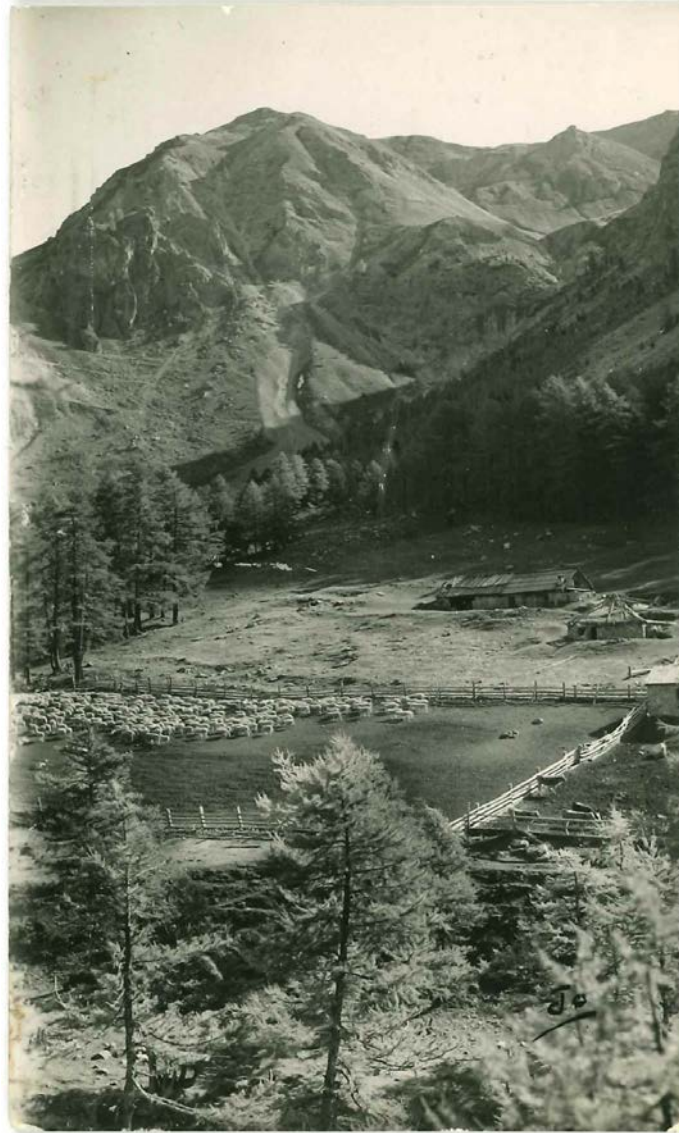
Le Cougnet en 1950