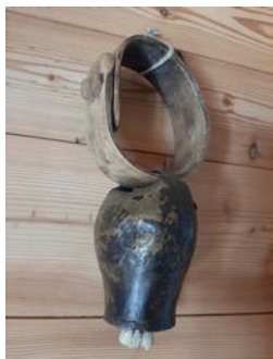
Bouronbill Pyrénéen avec collier fermé en frêne