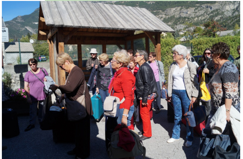
Le jour du départ pour la Corse