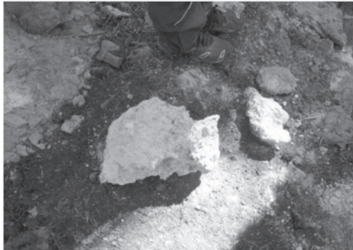
← Calcaire reconstitué reposant sur des débris charbonneux

Manifestement, il s'agissait d'un four à chaux à combustible bois (état final).