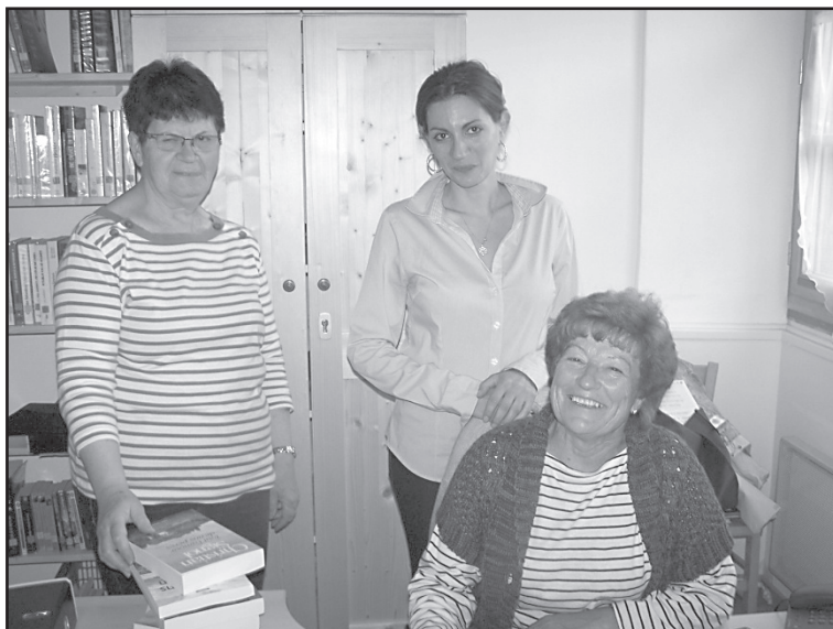
Trois des six bénévoles qui accueillent les lecteurs

La bibliothèque municipale est ouverte à tous, petits et grands, tous les mercredis de 16 h à 19 h. La municipalité a entièrement rénové l'an dernier le local accueillant ce pôle culturel dans une ambiance conviviale et feutrée. Deux fois par an, dans le cadre d'une convention avec la bibliothèque départementale de prêt (service du Conseil Général), le bibliobus s'arrête devant la bibliothèque du village et plus de 300 ouvrages sont ainsi renouvelés. C'est en septembre dernier que les bénévoles ont ainsi choisi les livres qui devraient satisfaire petits et grands. D'autre part, une malle pour les bébés lecteurs a été confiée pour une durée de deux mois et permettra d'aller à la crèche afin que les bénévoles sensibilisent, dès leur jeune âge, les petits pensionnaires de ce service situé à côté de la mairie. Des ouvrages récents ont été acquis et toutes les personnes intéressées sont invitées à venir rencontrer les bénévoles, sans engagement de leur part, et peut-être devenir adhérent de la bibliothèque afin de trouver, ou de retrouver, le plaisir de lire et de s'évader dans de lointains voyages où l'imagination se conjugue avec les émotions.