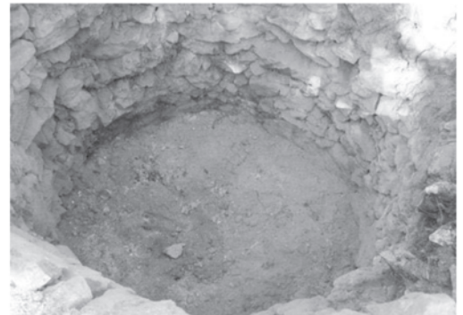
État final →

Manifestement, il s'agissait d'un four à chaux à combustible bois (état final).