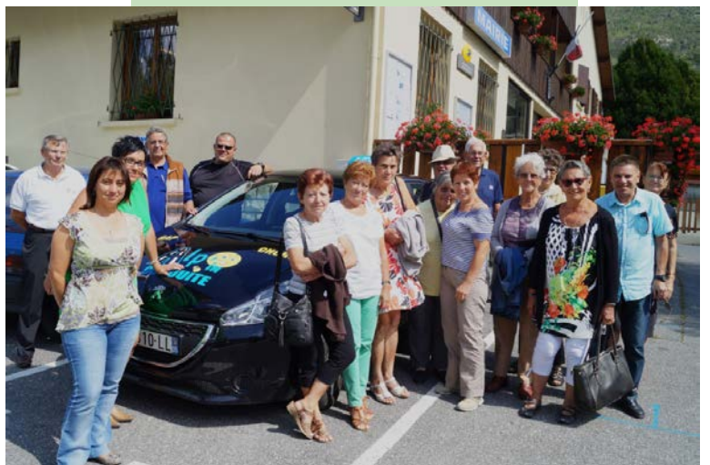
Les participants et les animateurs de la journée « prévention routière »