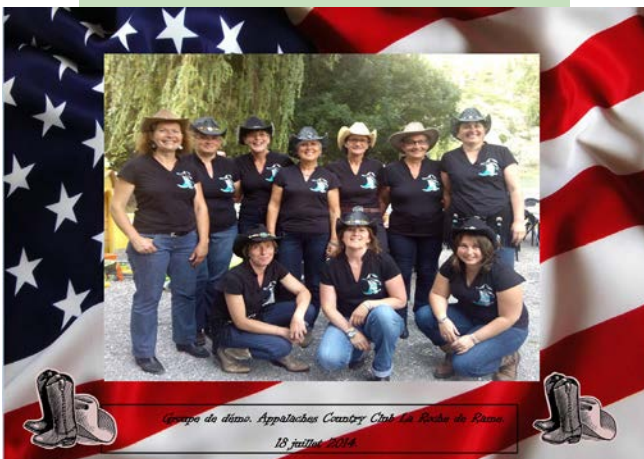
Groupe de danse, Appalachians Country Club Les Rives de Ranso 18 juillet 2014