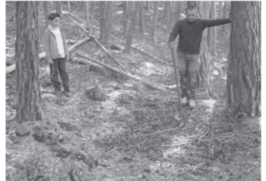
État initial →