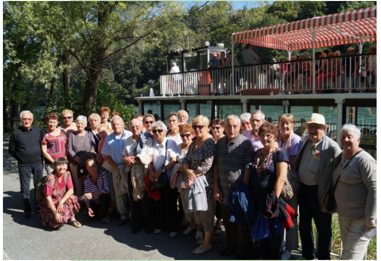
Devant le bateau à aubes sur l'Isère