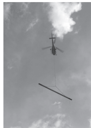
Hélicoptage des sacs de ciments et réalisation de martelières de régulation (prise d'eau du canal de Serre Duc)