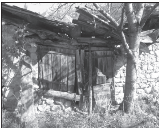
La forge de nos jours

D'ICI QUELQUES SEMAINES, VOUS POURREZ ÊTRE PARTIE PRENANTE DE LA SAUVEGARDE DE CE PATRIMOINE LOCAL EN PARTICIPANT A UNE SOUSCRIPTION PUBLIQUE. NOUS VOUS INFORMERONS DE LA SIMPLE DÉMARCHÉ A FAIRE. Votre participation permet de bénéficier d'une réduction d'impôt de 66 % !