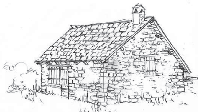
FORGE LA ROCHE DE RAME La forge quand elle sera restaurée