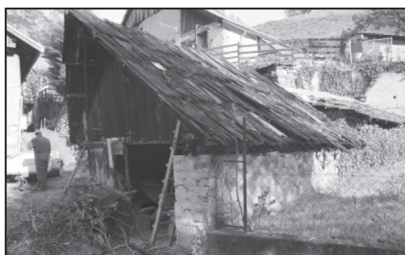
Le four nécessite essentiellement la réfection de la couverture