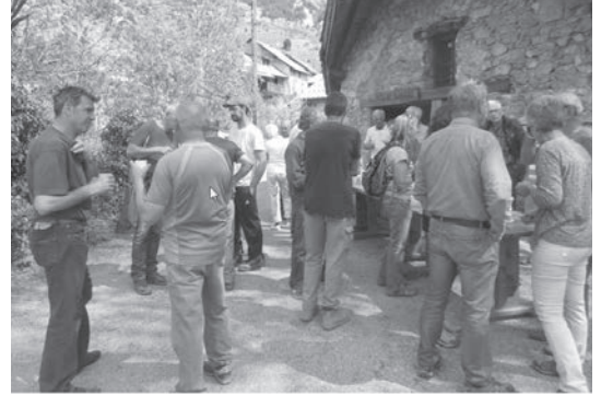
Pot de l'amitié à fin des corvées