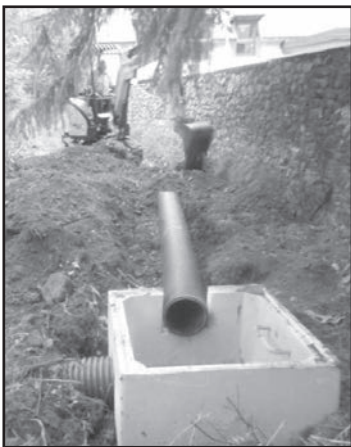
Derrière le Château, pose d'un piège à matériaux (1000 par 1000 ; location de pelle avec conducteur)