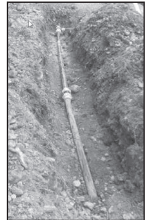
Et réparation sur les Frairies

Sur le captage du SERRE DUC et du CANAL de GUIERE va avoir lieu, courant juin, un héliportage (deux voyages, avec palettes de béton, martelière, et matériaux de coffrage).